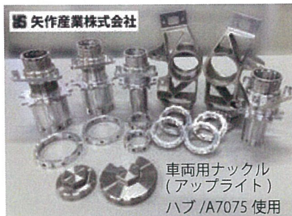
企業と部品の共同製作