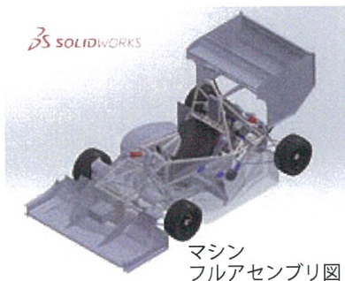
マシン フルアセンブリ図 マシン設計 (3D CAD)