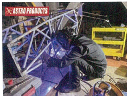
マシン製作 (フレーム溶接)